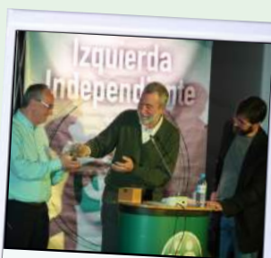
El jabón de "La Paca"